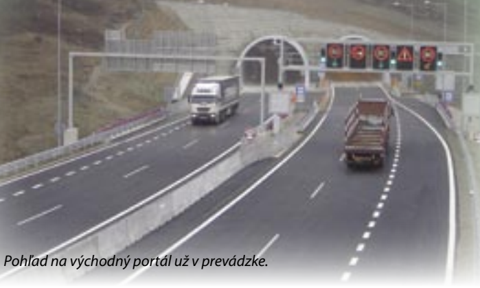
Pohľad na východný portál už v prevádzke.

zalo sa, že relatívne pomalý začiatok zákonite nesie risk hektického konca. A že ten koniec bude potom musieť byť nielen rýchly, ale priam ozlomkrky ra-