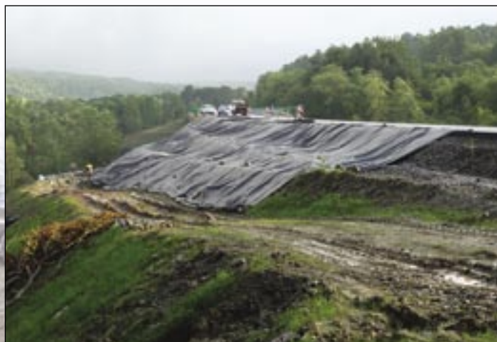
Zosuv pôdy na svidníckom obchvate.