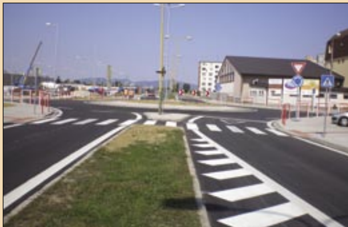
Križovatka pri bánoveckom Kauflande.