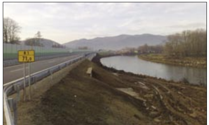
Rieka už tečie popri novej ceste.