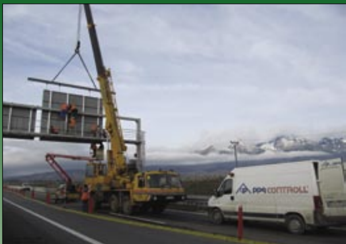
Montáž lamelovej premennej dopravnej značky.

Dobrá lekciiu majú za sebou aj Inžinierske stavby. Týka sa hlavne personálneho obsadzovania stavieb. Uká-