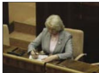
Ministerku práce Vieru Tomanovú takto zaujala rozprava o štátnom rozpočte.