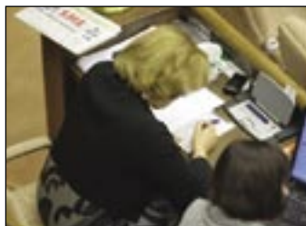
Magda Vášáryová lúšti sudoku v parlamentnej lavici.

konkurenciu. A to priamo v opozičnom politickom tábore! Ministerka práce Viera Tomanová neodolala sudoku dokonca počas rozpravy o štátnom rozpočte. „Niekedy je neúnosné počúvať kritiku zákonov od poslancov. Na prepadnutie tejto záľube som nemala zatiaľ dost času, je to pre mňa príležitostná kratochvíľa,“ zahmlievala pani Tomanová. No, milí kolegovia, v každom prípade si z nich neberte príklad a hlavolamy radšej lúštite doma. Poďakujte sa vám minimálne zamestnávateľ. toB, Nový čas