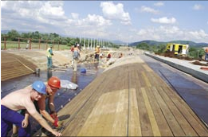
Z prác na moste pri Hornej Ždani. Vľavo zamestnanci firmy Steel-Max Beluša.

Počas šesťnástich mesiacov prestavať vyše 6 miliónov eur. Táto číselná úloha rozmenená na drobné znamenala pre CESTY NITRA realizáciu prestížnej subdodávky. Združenie R1 – Eurovia sa mohlo na COLAS-ákov spoľahnúť. Odovzdanie stavby do užívania tri mesiace pred termínom neuniklo pozornosti ani na najvyšších miestach.