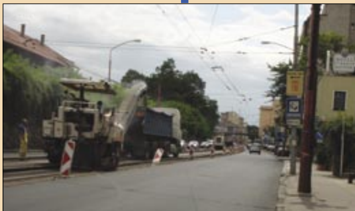
Dve frézy v plnej permanencii na Pražskej v Bratislave.

Aj v neľahkom období krízy idú CESTY NITRA za svojou víziou. Pomôcť na-