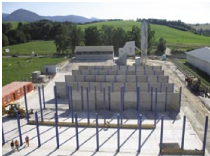
V pozadí betonáreň, vľavo dokončovanie spevnených plôch na obalovacej súprave Žilina.