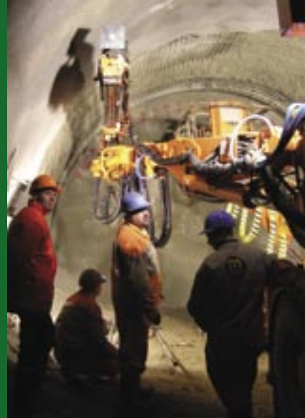
Vrtanie ochranného dáždnika v pilierovej štôlni na západnom portáli.

Deň slávnostného otvorenia 25. novembra si nenechali ujsť ani slovenské politické špičky, vrátane predsedu parlamentu a premiéra. Páska sa však ešte nestrihala, tunel čakali predpísané skúšky. Napokon všetko dopadlo nad očakávanie dobre. Diaľnica a tunel boli pre Podtatrancov príliš zaujímavé, než aby otvorenie prešlo bez povšimnu-