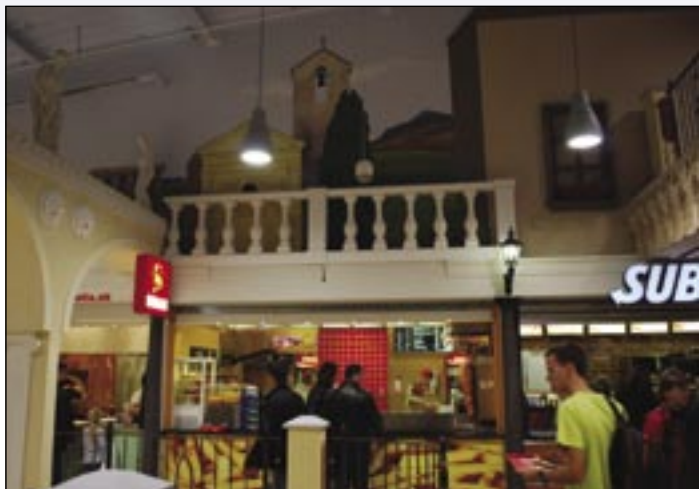
Na poslednom poschodí Galérie Košice.