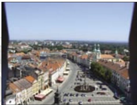
Hradec Králové z Bílé věže. Vasil Ceral.