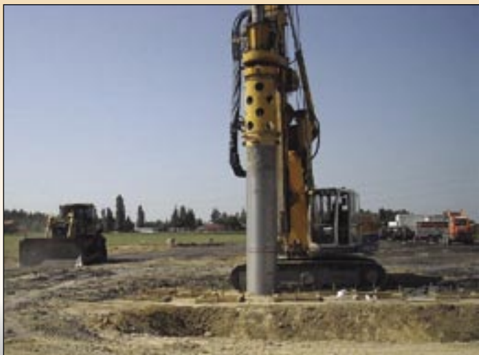
Závod Jih se letos pustil do obchvatu severomoravského města Příbor.

Trumfem byly dvě zakázky. Nový železniční koridor Stříbro – Planá u Mariánských Lázní spotřeboval téměř 100 000 tun suroviny (dražní štěrky 32/63 Bl a štěrky drtí 0/32kv). Pro to samé množství našli odběratele i na obchvatu Moravských Budějovic. Tady se uká-