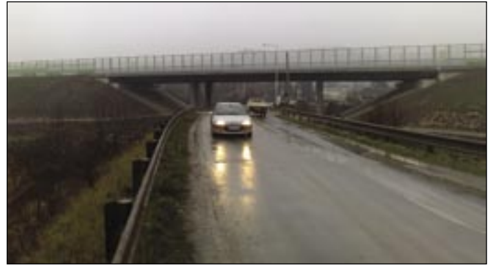
Hotový most aj s časťou protihlukovej steny.