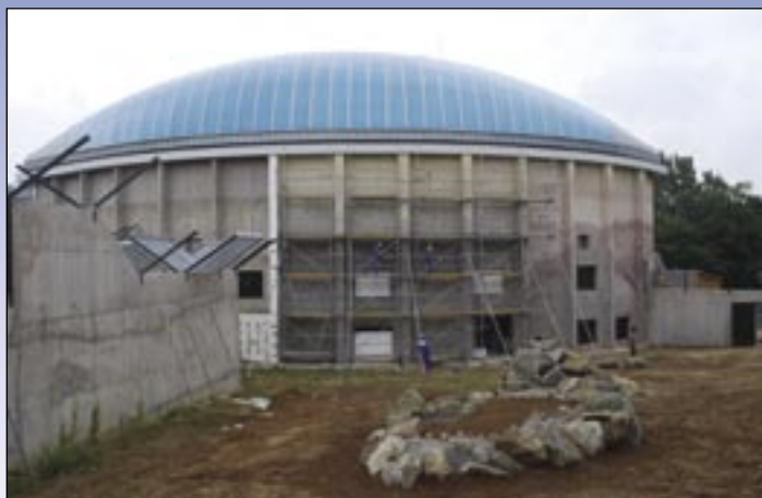
Moderný pavilón primátov vyrástol v bratislavskej ZOO.

Väčší dopyt po rekonštrukciách ciest zo strany samosprávnych krajov sme využili. Synergia zabrala najmä v Žiline. Pracovalo sa v okolí rázovitých obcí ako Terchová alebo Čičmany. Do Banskobystrického kraja tiež smerovalo v roku 2009 množstvo úsilia – od okresu Revúca cez Žiar nad Hronom až po Veľký Krtíš. Neustratili sme sa ani v Prešovskom (Vranov, Svidník, Stará Ľubovňa) a Košickom kraji.