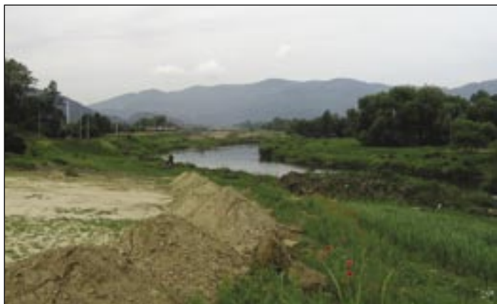
Na dvoch záberoch s odstupom poldruha roka zreteľne vidieť preloženie Hrona.

Nová komunikácia sa napája na úsek už postavenej R1 od Hronského