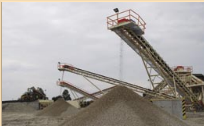
Štrkovňa a technologická linka vo Veľkom Grobe. Majú obrovský potenciál.