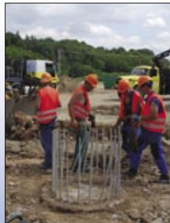
Partia z Inžinierskych stavieb, závod 06, na stavbe rýchlostnej cesty R1.

○ Jadrová elektrárň Mochovce - práce na primárnom okruhu ○ Privádzáč Poprad – Matejovce - 1. a 3. časť úseku ○ Práca na prvom balíku PPP projektu, najmä úseku D1 Fričovce - Svinia