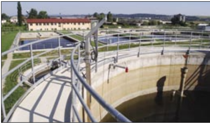
Najväčším srdcom stavby je čistiareň odpadových vôd vo Vranove-Lomnici.