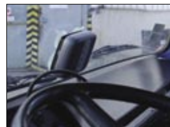
Palubná jednotka na čelnom skle.

A systém funguje? Po začiatkových problémoch sa zdá byť všetko v relatívnom poriadku. „Najprv dobre nepracoval internetový registračný formulár na stránke firmy Skytoll, prevádzkova-