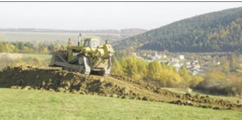
Stráne na Šariši menia tvár.

COLAS figuruje v konzorciu silných firiem, ktoré čaká tzv. 1. balík PPP projektov - stavba vyše 70 kilometrov chýbajúcej severnej a východnej diaľnice D1 medzi Martinom a Prešovom. Inžinierske stavby ako hlavná súčasť COLAS-u povedú réžiu úseku Fričovce – Svinia s dĺžkou 11 217 metrov. Najmä pre Prešovčanov je tento úsek priam za humnami. Ľahké sústo to ale rozhodne nebude. Tvori ho 84 stavebných objektov, z toho 15 mostov. Konečné dielo obsiahne napríklad 200 737 m 2 plochy vozovky či 3 506 metrov protihlukových stien. IS by sa podľa predbežných správ mohli podieľať aj na stavbe mostov ďalšieho úseku, D1 Jánovce – Jablonov, ktorý bude merať okolo 18 kilometrov a obide napríklad mesto Levoča. tob