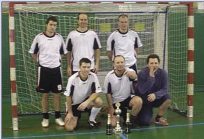
Colas Cup: Vítězný tým Střediska stavební výroby Tábor.

Stavby Colasu jsou firemními novinami zaměstnanců společnosti: