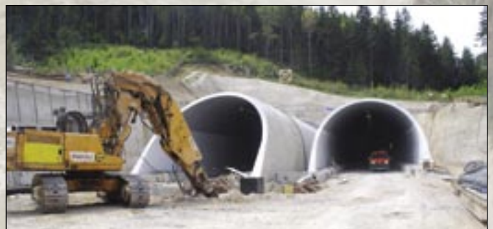
Východný portál tunela Bôrik – stav v polovici mája.