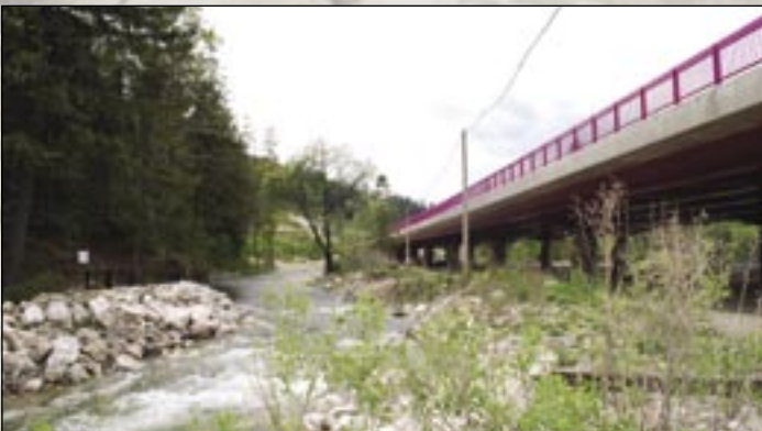
202 ponad rieku Poprad neďaleko tunela.

Niekoľko krokov od tunela premostuje rieku Poprad. Zvláštnosťou je oceľový rošt pod mostovkou. Natreli ho ružovou farbou, typickou pre diela zhotovené pre Národnú diaľničnú. Rošt má hmotnosť 1 360 ton a ďalšie tri tony vážia zvary v rošte. Most je najdlhším v trase úseku, meria okolo štvrt kilometra. Ľavý most má o jedno pole viac ako pravý.