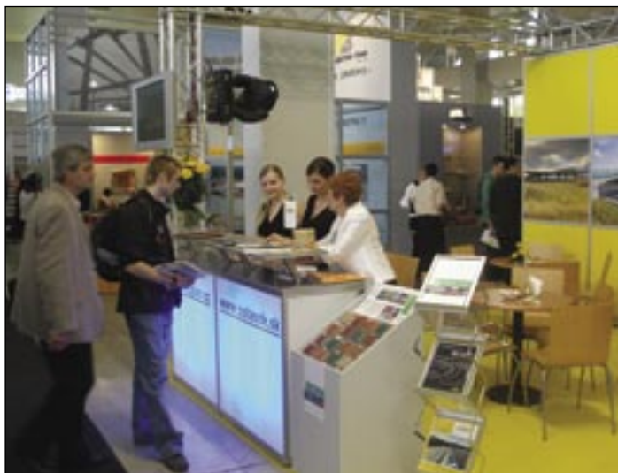
Spoločná expozícia COLAS-u ČR a SR