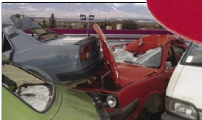
Robme všetko pre to, aby z nášho srdca nebol predčasne „vrak“...

neduhmi si vie poradiť vlastnými obrannými mechanizmami. No všetky víťazné boje počas života na ňom zanechali stopy a