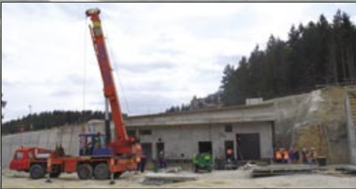
Rodí sa trafostanica pri východnom portáli. V hotovom stave bude terén okolo budovy úplne zasypaný.

Úsek začína kilometrovým dvojrúrovňovým tunelom Bôrik. Pri východnom portáli je stále veľmi rušno. Koncom mája boli dokončené trafostanice a upravený terén. A na predportálových úseky prebieha pokládka záverečných blokov cementobetónovej vozovky.