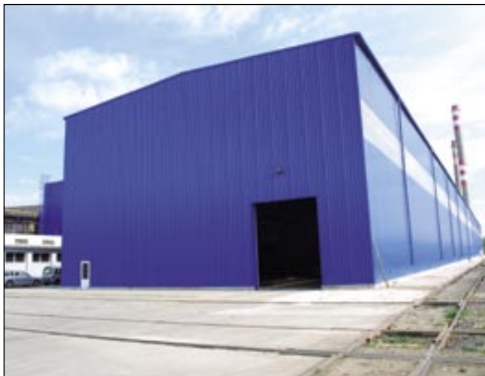
Pohľad na vynovenú „starú“ halu. Nová sa skrýva za ňou.