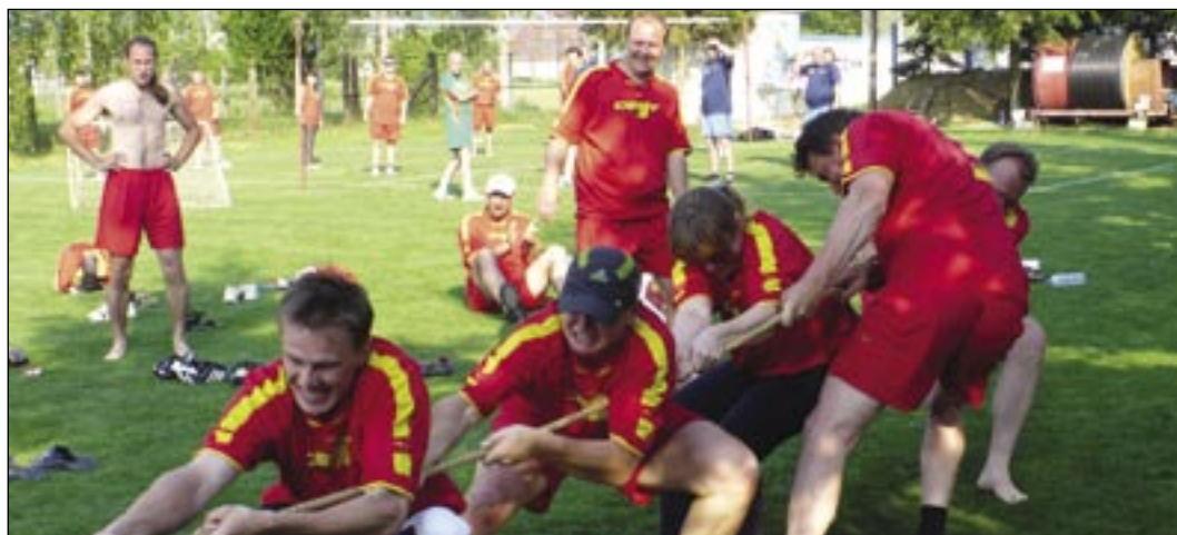
Pri preťahovaní o náklady na športové hry vyšla tento rok víťazne kríza.

• Za rozhovor ďakuje Anton Oberhauser