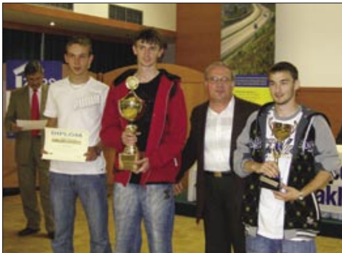
Pohľad na ocenených študentov.

pečnosť a ochrana zdravia pri práci. Už 35. ročník partnersky podporili aj Inžinierske stavby. Najúspešnejšími školami boli SOŠ stavebná z Banskej Bystrice a SOŠ obchodu a služieb z Trnavy.