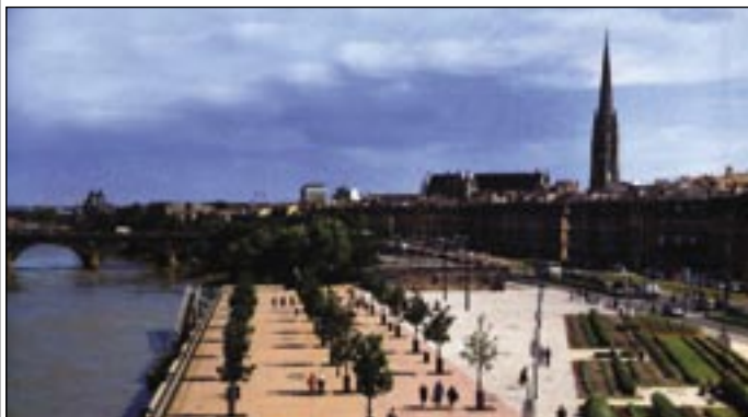
Promenáda z dielne COLAS-ákov v Bordeaux na juhozápade Francúzska.

Stavby Colasu sú podnikovými novinami zamestnancov spoločnosti: