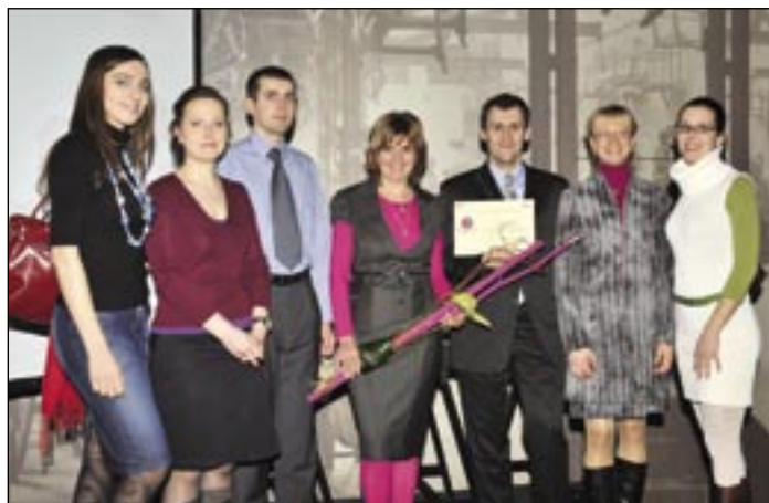
Členovia, klienti a spolupracovníci Communication House prevzli cenu PROKOP 2010.