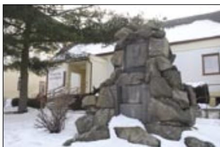
Rodný dům akademického malíře F. B. Zvěřiny v Hrotovicích.

vyžití rybářům a vyznavačům vodních sportů. Národní přírodní rezervace Mohelenská hadcová step je bohatá na výjimečné množství rostlinných a živočišných druhů. kš