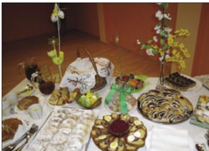
Ukážka veľkonočných dobrôt z východoslovenskej obce Kokšov-Bakša.

Na Slovensku sa šibe zväčša na západe, na východe prevláda oblievačka. Chlapci oblievali dievčatá už od skorého rána. Väčšinou vždy pri studni a neraz i v miestnom potoku. V utorok po Veľkej noci zas mali hlavné slovo ženy. V Česku môžu s vedrom na mužov čakať už v pondelok popoludní. Čo je príčinou tohto zvyku? Vraví sa, že dievčatá majú byť na Veľkú noc vyšľahané, aby zostali zdravé a uchovali si plodnosť. šim