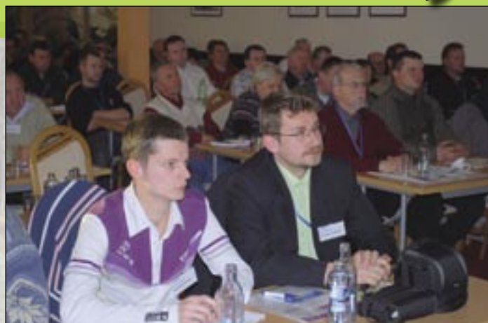
Do Starej Lesnej prišlo v trochu turnusoch okolo 300 zamestnancov.