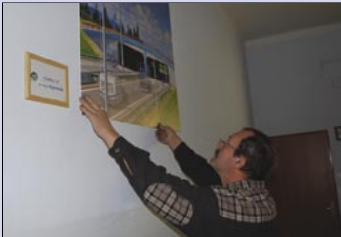
Na chodbách visia obrazy z najznámejších stavieb IS.