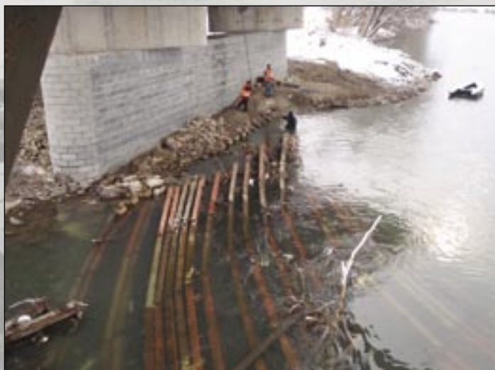
Potopené nosníky Peiner 2000 v koryte Hrona, v pozadí skupina potápačov a obložený pilier číslo 3.